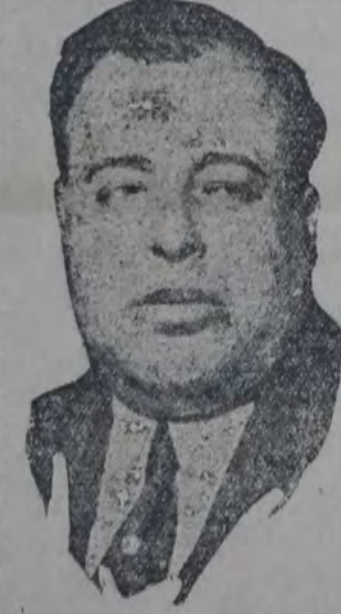
MINISTRO DEL TRABAJO DE México y dirigente laborista

pública Mexicana, en este instante sufre en que la Revolución está por dictar su fallo definitivo a la nación; se preguntan hacia adónde irán los elementos que ayer salieron del seno de los estudiantes para ir al campo de la lucha política, naturalmente sin olvidarse de su origen, sino, por el contrario, para servir mejor.