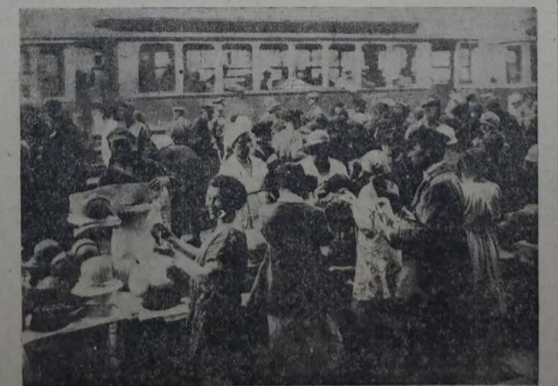
PASADO EL VENDAVAL REVOLUCIONARIO DE RUSIA, QUE TRANSFORMO TODAS LAS CONDICIONES de vida del país e hizo surgir nuevas relaciones sociales y económicas, volvió al pueblo de las ciudades y del campo del ex imperio de los zares a sus actividades normales. He aquí una calle de Moscú, en la que el público muestra mucha animación a un mercado de sombreros. Pero se han trocado los papeles: a consecuencia del satelismo revolucionario, muchas de las vendedoras son damas de las antiguas familias nobles arruinadas, y las compradoras, hijas del pueblo.