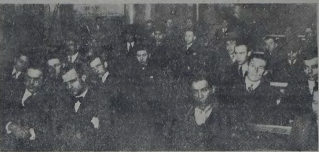
VISTA TOMADA EN EL CENTRO SOCIALISTA DE LA 13a. DURANTE EL MITIN REALIZADO AYER

Con una concurrencia que llenaba totalmente el local, realizó el mitin antifascista organizado por el Centro Socialista de la sección 13a.