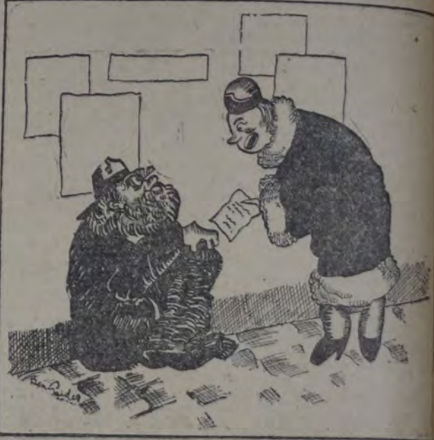
UNA DE LAS ENCARGADAS DE "JUNTAR" PARA EL SILLON DEL PELUDO. — Caballero, ¿su óbolo?